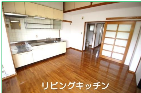
リビングキッチン