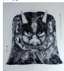
応声教院 山門 鬼瓦 佐々木鐵心画