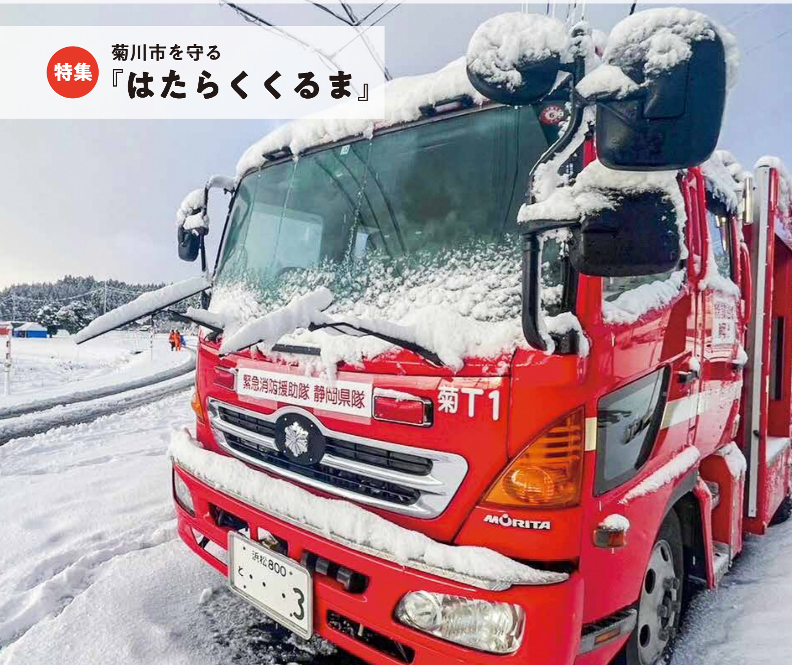
令和6年1月1日発生 能登半島地震被災地珠洲市にて