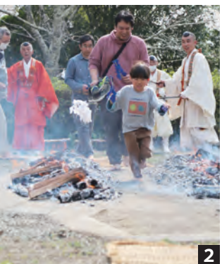
1 先人への感謝の読経 2 炎の間の道を裸足で歩く火渡り