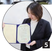
1 新茶を一つひとつ丁寧に摘み取る 2 先人たちの功労に感謝し、今年の茶業の発展を祈る 3 茶の品質を真剣に吟味 4 威勢よく手を打ち、商談が成立 5 GI アワードの賞状を掲げる茶業協会職員