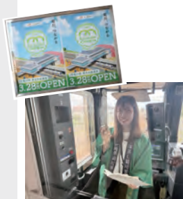
▲車掌席からアナウンス

茶畑のやわらかな曲線と、南北をつなぐ自由通路のイメージを重ねながら、菊川らしさと新駅舎完成の節目がやさしく伝わるようデザイン。このロゴをメインビジュアルとして、ポスターや特急「さきがわ」号でのヘッドカバーなどにも展開し、イベントを盛り上げました。新駅舎の開通式当日には、特急「さきがわ」号の車内アナウンスも担当し、貴重な体験となりました！