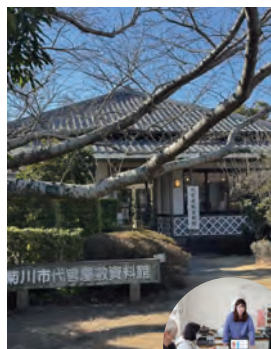
スタッフと意見交換▶

菊川市が誇る国指定重要文化財「黒田家代官屋敷」。その資料館での展示をより分かりやすく、何度でも足を運びたくなる場所にするため、展示改善プロジェクトがスタートしました。私一人ではなく、資料館スタッフの皆さんにも意見を伺いながら「どうすればもっと歴史の面白さが伝わるか」「ここにきたら、次はこの資料も見たいくなるのではないか」