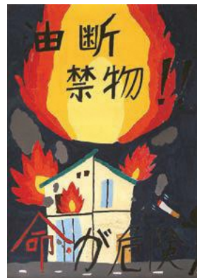
▲令和5年度防火ポスターコンクール金賞受賞作品