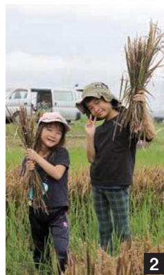
1 刈り取られていく家康公 2 立派な稲穂を手にポーズ