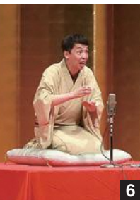
1 大勢の人が出席しました 2 市長から今年100歳を迎えた人へ記念品が手渡される 3 4 会場が美しい歌声とピアノの音色で包まれる 5 市長も得意のハーモニカとパーカッションでお祝い 6 立川晴の輔さんが軽妙な落語を披露

9月17日、敬老の日を前に、長寿を祝い、多年にわたり社会につくしてきた高齢者の皆さんに感謝の意を表す敬老会が、文化会館アエル大ホールで開催されました。今年度中に77歳、80歳、88歳、90歳、99歳以上となる高齢者1,539人を対象として開催され、345人が出席しました。