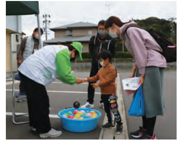
▲ふれあいフェスタ(六郷地区)