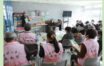
▲高齢者サロンの開催(嶺田地区)