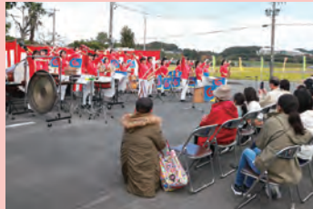
▲地区センター祭り(横地地区)