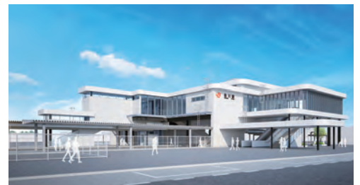
▲南北自由通路および新駅舎のイメージ(南口)