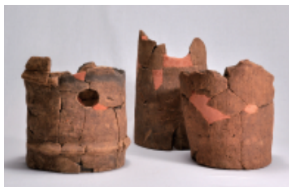
鹿島古墳の埴輪 削平の時などに掘り出されたものと考えられ、古墳に立て置かれた下部が残っていたようです。左の写真は円筒埴輪、右の写真は動物形の埴輪の脚です。脚には蹄の表現の切り込みがあります。5本あるので2頭以上の馬か鹿などの埴輪があったことがわかります。