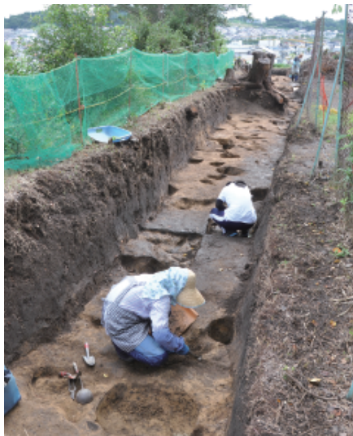
発掘調査の様子 様々な穴が発見され、調べています