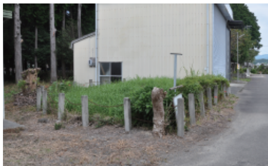
鹿島古墳の現状 草が茂る範囲が小高くなっている部分