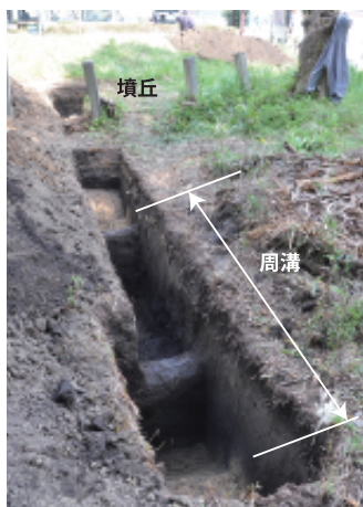
古墳の周溝の発見