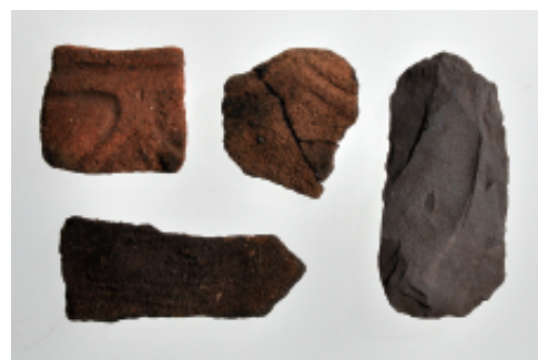
出土品の一部 縄文時代の土器の破片と石器