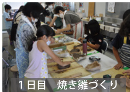
1日目 焼き雛づくり