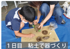
1日目 粘土で器づくり