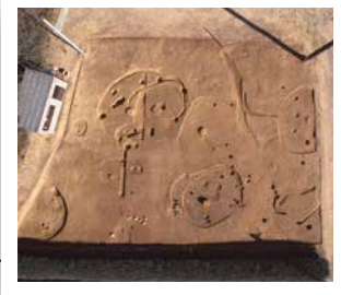
祢宜屋敷遺跡 堅穴建物跡が多数検出され、縄文時代と弥生時代の集落と判明しました。