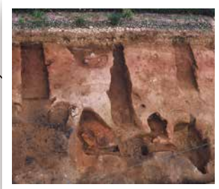
皿山古窯跡群 平安時代後期から鎌倉・室町時代にかけて、碗や皿などの陶器を生産する窯がありました。