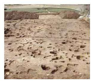
石畑遺跡 縄文時代の堅穴建物跡のほか、多くの土器や石器が発掘調査で確認されました。