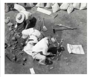
千駄ヶ原遺跡 河城地区の縄文時代の中でも注目される遺跡として、古くから発掘調査が行われています。