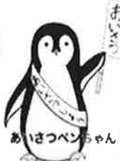
あいさつペンちゃん