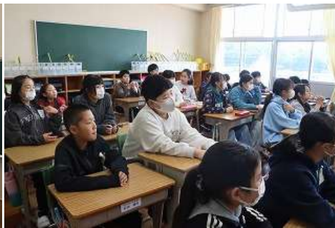
令和8年4月7日（火曜日） 令和8年度入学式