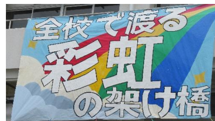
【美術部作成のスローガン】