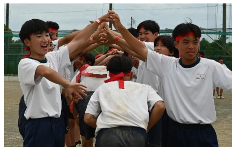
【仲間を称えるアーチ】