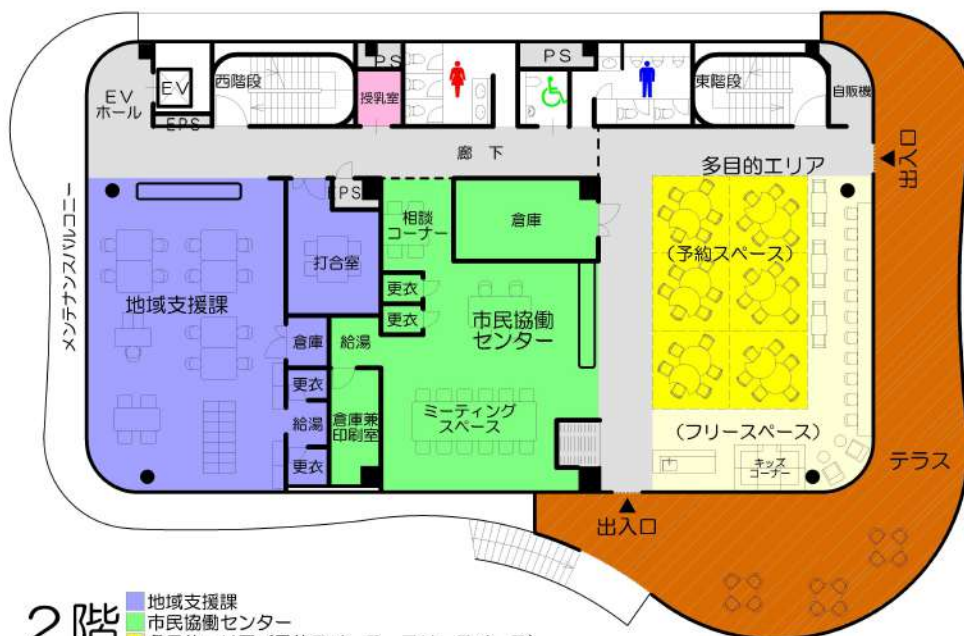
2階 ■ 地域支援課 ■ 市民協働センター ■ 多目的エリア (予約スペース、フリースペース)