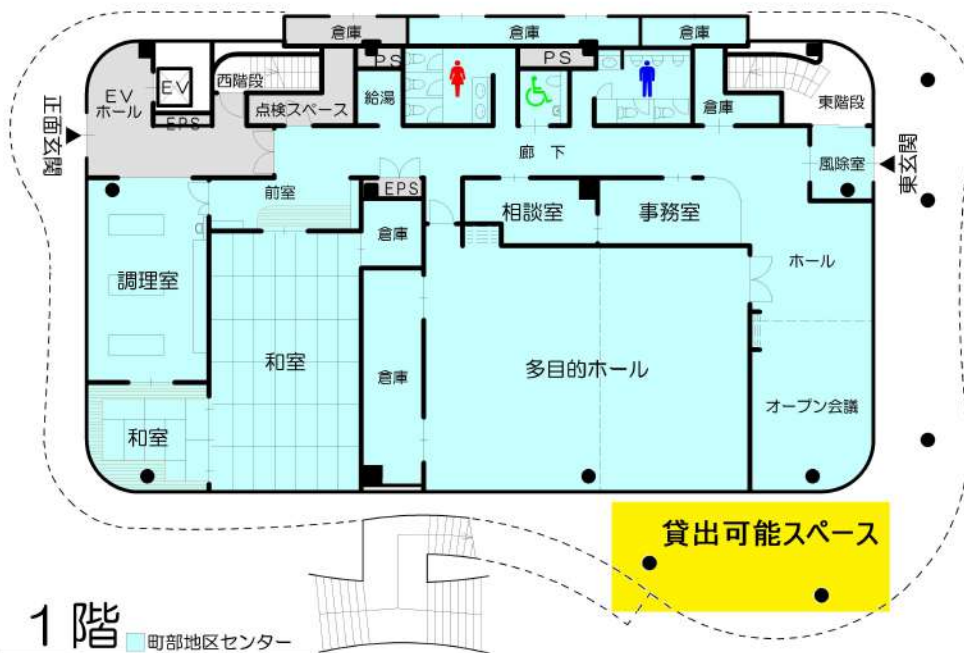
1階 ■ 町部地区センター