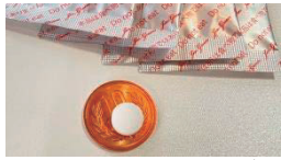
10円硬貨とのサイズ比較

災害が起きると、衛生状態を保つことが難しくなり感染症リスクが高まります。 非常用持出し袋に備えて感染症対策!!