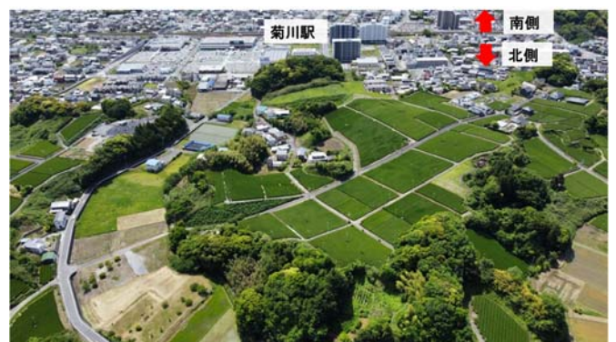
図3.駅北地域航空写真 (北から南を望む)

さらに現在、南北自由通路の整備が進んでおり、令和8年3月に自由通路が開通する予定となっています。その後は北口駅前広場の整備も予定しており、この地域はまちづくりのポテンシャルが大きく、優良な地域となることが予想されます。