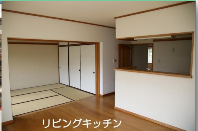
リビングキッチン