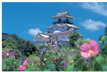
掛川城 Kakegawa Castle