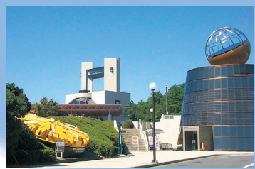
浜岡原子力館 Hamaoka Nuclear Exhibition Center