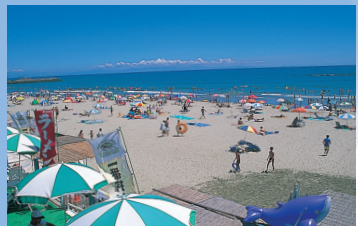
相良海水浴場 Sagara Seaside Resort