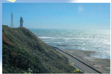
御前埼灯台 Omaezaki Lighthouse