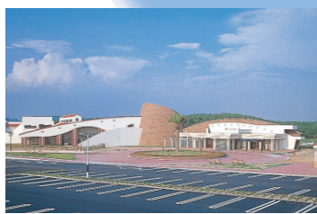
大東温泉シートピア Daito Spa Seatopia