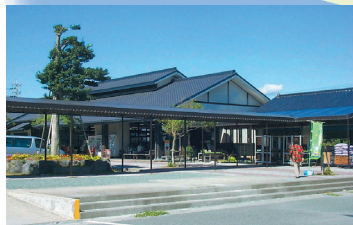
サンサンファーム Sun Sun Farm