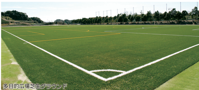
多目的広場芝生グラウンド