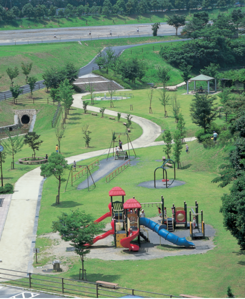
キャッスルヒルのビッグキャッスル