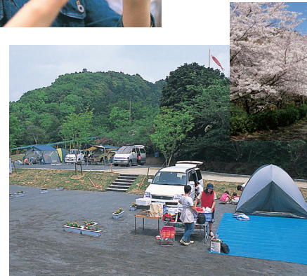
火剣山バンガローと 満開の桜