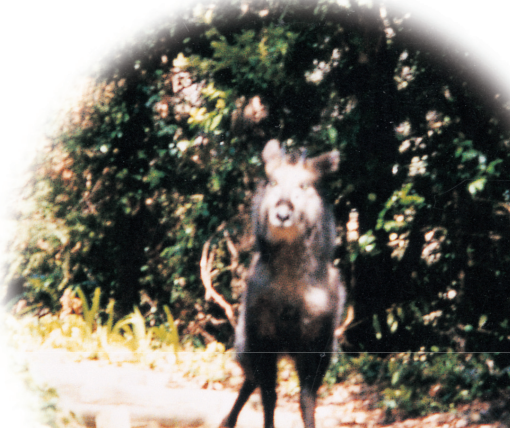
南アルプスからはるばるやってきたのだろうか。 幻のカモシカ。 運がよければ出会うことができるかも。