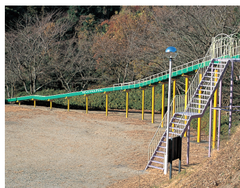
全長70mの大ローラー滑り台