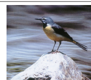
市の鳥「キセキレイ」