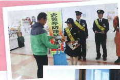
幼年防火クラブの園児と 一緒に、市民の皆さんに 防火を呼びかけました。