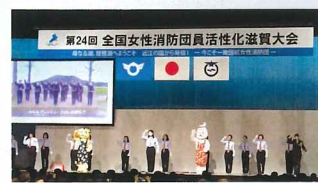
滋賀県で開催された女性消防団員の全国 大会へ参加し、他県の活動を学びました。