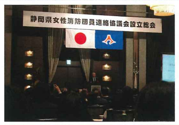
静岡県女性消防団員連絡協議会が設立され、 研修会と設立総会に参加し他市の女性団員 と活動について情報交換をしました。