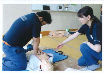
毎年、7～8月に男性団員に 応急手当の指導をしています。

毎月第3土曜日には、消防署内の救急指導室において、普通救命講習が開催され、私達も指導のお手伝いをしていますので、ぜひ参加してみてください。