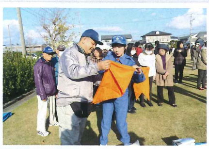
12月2日の地域防災訓練時に三軒家自治会へ出向き、 心肺蘇生法やAED・三角巾の使用方法を指導しました。