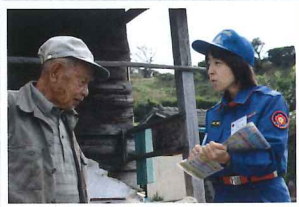
火災シーズンの前に1人暮らしの高齢者のお宅を訪問し、防火指導を行っています。