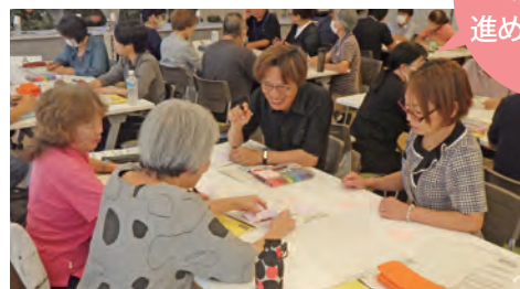
女性と地域防災役員がつながるお話し会 9～11月に開催。もしもに備えて『地域でできること』を話し合いました。