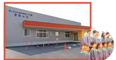
▲小笠北認定こども園完成