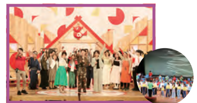
▲さまざまな市制20周年記念事業