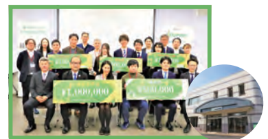
▲菊川チャレンジビジネスコンテスト