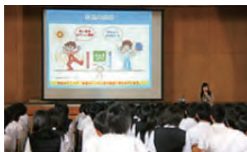
▲熱中対策セミナーを実施

事業を通じた社会課題の解決に取り組み、自社の持続的成長とサステナブルな社会の実現を目指しています。「世界の人々へウェルビーイングを提供」や「地球環境への負荷軽減」など4つのマテリアリティ(重要項目)に基づく取り組みを行っています。また、熱中症対策など健康に関する啓発活動の実施や、ペットボトルのリサイクル推進、災害支援などにも取り組み、地球環境や地域社会に貢献しています。