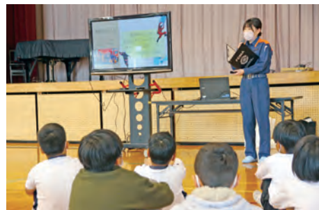
▲女性消防士による小学生への職業講話