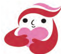
▲犯罪被害者等支援シンボルマーク「ギョつとちゃん」