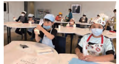
▲キクルデソクル(子どもたちのパン作り)

な活動や仕組みづくりなどになります。令和4年度からは、新たに行政が提案する課題を解決する活動を募集します。