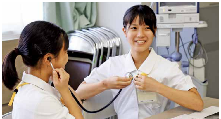
▲聴診器の使い方を体験し、仕事に興味を持つ

8月7日から9日まで、菊川市立総合病院で「高校生1日ナース体験」が開催されました。看護師志望や興味のある高校生に、実際の病棟での業務を体験してもらい、看護師の仕事を知ってもらうことが目的。市内および近隣の高校に通う生徒10人が参加しました。参加者は、リハビリテーション科や診療放射線科、外来診療など院内の様子を見学。また、入院患者への血圧測定をしたり、参加者同士で聴診器を用いて心臓や肺の音を聞いたりして、命に携わる看護師の仕事の重みを実感しました。