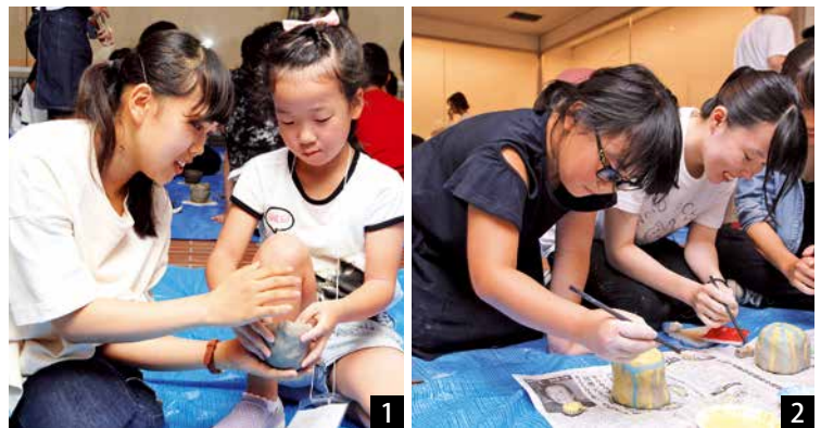
▲1_アドバイスをもらいながら、形作る 2_きれいに色を施していく

参加者は、講師や常葉大学附属菊川高校美術・デザイン科生徒の協力を得ながら、自分だけの陶風鈴を完成させました。