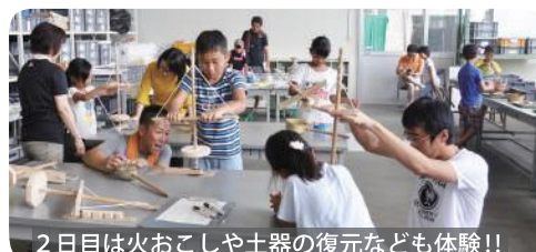
2日目は火おこしや土器の復元なども体験!!

完成品は、夏休みの後半に中央公民館に展示した後、それぞれの作成者にお渡ししました。