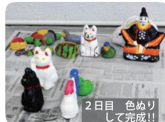
2日目 色ぬりして完成!!