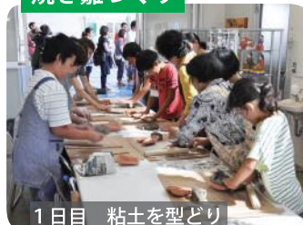
1日目 粘土を型どり