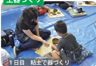
1日目 粘土で器づくり