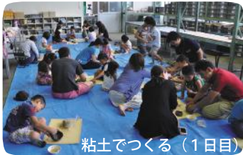
粘土でつくる(1日目)

7月22日(日)と8月5日(日)の2日間で、それぞれ完成させます。くわしくはチラシを見てね。