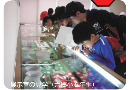
展示室の見学(六郷小6年生)

なお、みなさんの学校や公民館などに職員が向ういて文化財を紹介する、出前講座も行っています。