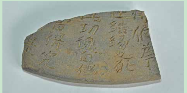
皿山古窯跡群 経筒外容器

菊川市和田の皿山古窯跡群から出土した、經典 きやうてん を入れた経筒を埋納する際に使用された陶製の外筒の蓋です。12世紀前半頃に製作されたと考えられ、外面には工具で「結縁」や「功德」などの願文が刻まれています。