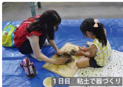
1日目 粘土で器づくり