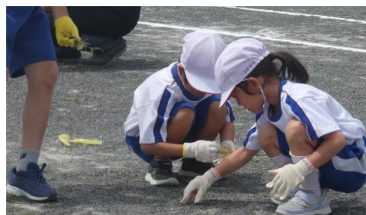
(草取り大会の「収穫」は約 6.5kg!)