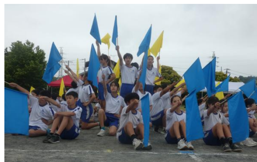
(5・6年生の集団演技 パッチリ決まりました! グッジョブ!!)