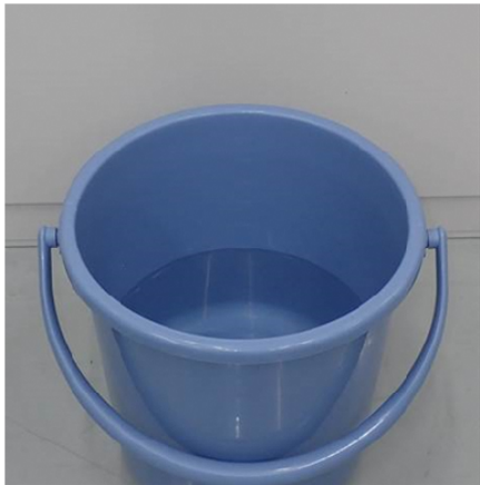
①水を張ったバケツを準備