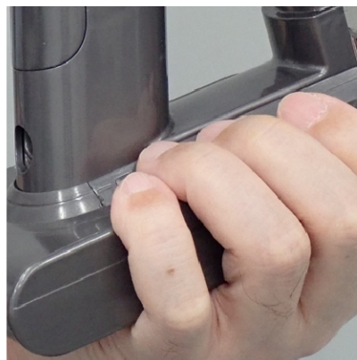
④手のひらをバッテリー底面、指をバッテリー上面にあてがう