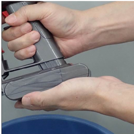
②バッテリーを掃除機に装着