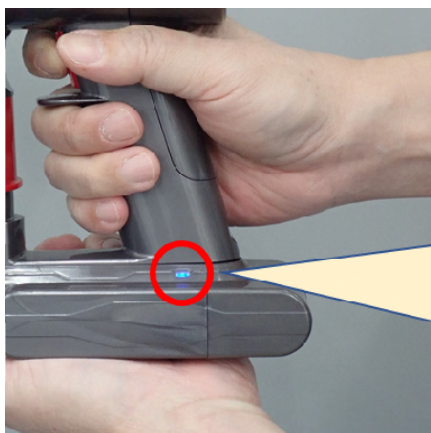
⑤バケツの上で、電池切れになるまで掃除機を運転

運転中、パイロットランプは「点灯」します。電池切れになると、パイロットランプが「点滅」状態になります。