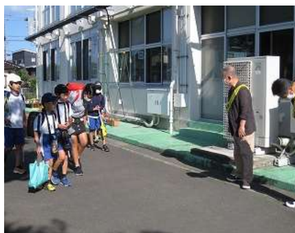
民生・児童委員さんによる挨拶運動