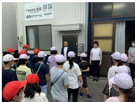
小笠東小 地元の企業で学ぶ