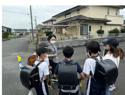
地区連絡員(保護者)と通学路点検