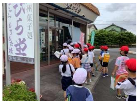
小笠北小 まち探検で地元商店を見学