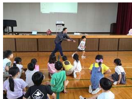
警察署による防犯教室