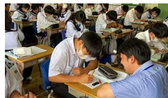
一人一人に言葉かけ(岳洋中)