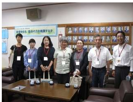
小笠南小 読み聞かせの皆さん