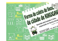
Forma de coleta de lixo da cidade de Kikugawa (guia em português)