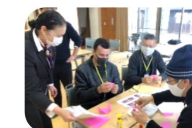
Intercâmbio multicultural de residentes japoneses e estrangeiros