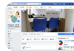
Divulgação de informações úteis para o cotidiano através do Facebook