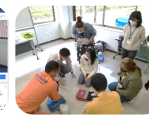
Seminário de Primeiros Socorros para Estrangeiros