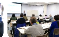
Curso de formação de voluntários no ensino da língua japonesa