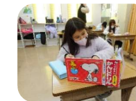
Suporte de língua japonesa para estudantes estrangeiros (Niji no Kakehashi)