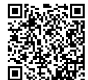
電子申請フォーム