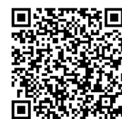
Mercado livre “Merukari Shops”