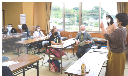
↑ Japanese language class for beginners

Contact Chiiki Shien-ka, Shimin Kyodo-kakari (☎35-0925)