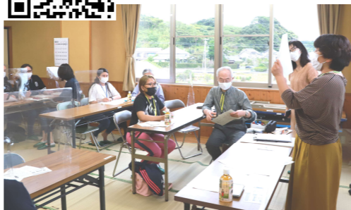
↑日本語教室(初級レベル)