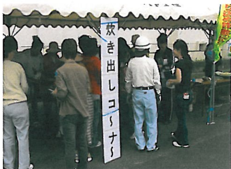
炊き出しコーナー