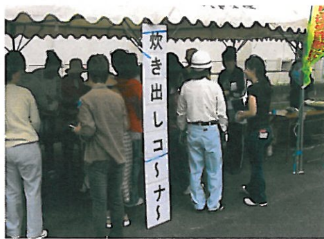
Preparação de alimentos de emergência