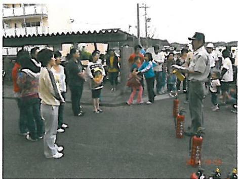
消火器の使い方講座

9月25日(日曜日)に、「平成23年度 平川地区安心・安全まちづくり大会～総合防災訓練～」が行われました。菊川市の平川地区自治会のメンバーでつくる平川地区防災会が主催となって、ブラジル人など外国人が多く住む五反通を中心に、さまざまな訓練を体験することができました。今回の防災訓練では、自治会からの依頼により消防署・警察署・消防団と多くの「防災・災害」に関係する方々の協力もあり、消火器の使い方・負傷者の搬送方法を学ぶ体験など、10種類以上の訓練を学ぶことができました。また、参加者約300人のうち3分の1が外国人の方々ということもあり、会場内では外国語(ポルトガル語・スペイン語のみ)での110番教室やパトカーや白バイの体験乗車、交通指導教室といった外国人のための学びの場が設けられていました。参加者は、「国籍や言葉の違いはありますが、同じ場所に住んでいるのでお互いが助け合えるように一緒に学べる機会があった。とても勉強になった。」と喜んでいました。今回のように日本人・外国人と関係なく一緒に学んでお互いを助け合えるための勉強の場が増えていけるよう皆で協力していきたいですね。