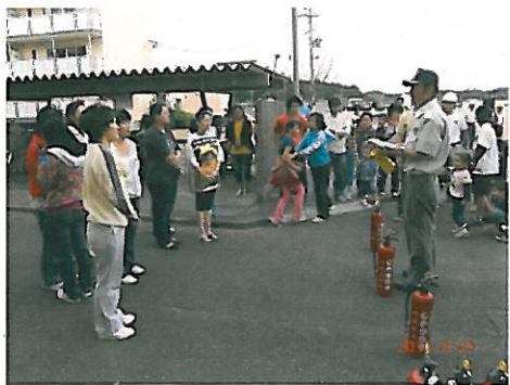
Demonstração do uso de extintor

Seguindo este exemplo devemos promover oportunidades de estudo e convivência entre todos independente das nacionalidades, esperamos a participação de todos.